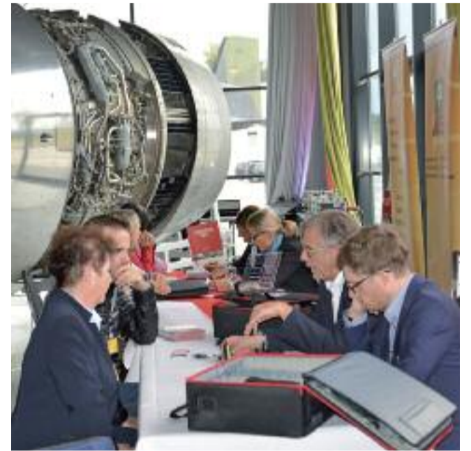
Stände im technischen Ambiente des Museums.

sive Gespräche mit Ausstellern führte. Gauf bezeichnete in seinem Grußwort die VPR-Mitglieder als wichtige Partner des RDA. Er wies darauf hin, dass sich auch die Busreiseveranstalter in Zeiten der Verunsicherung und Krisen umstellen und neue Reiseziele finden müssten, wenn bewährte Desti-