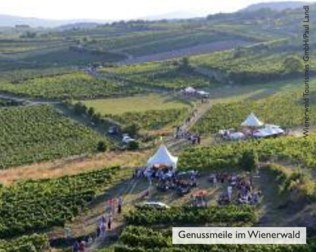
Genussmeile im Wienerwald