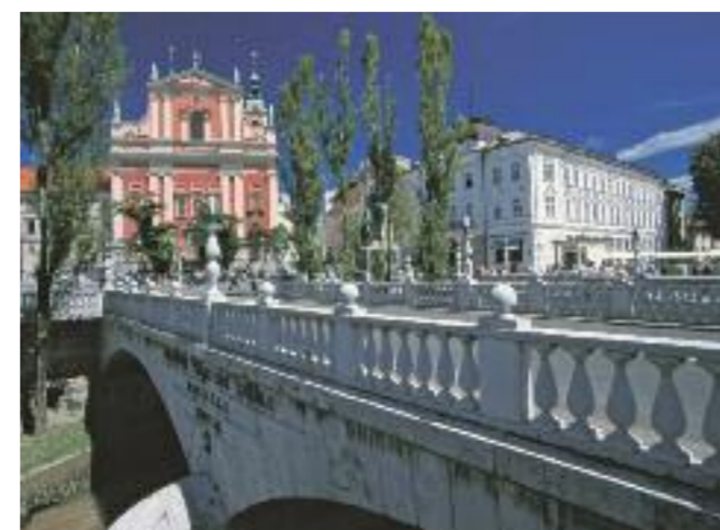
Brücke mit Franziskaner Kirche in Ljubljana.

„Slowenien ist Europa im Miniaturformat, und das werden wir mit der Partnerschaft bei der ITB Berlin 2017 bekannt machen“, sagt Majda Rozina Dolenc, Direktorin des Slowenischen Fremdenverkehrsamtes. „Slowenien ist ein Beispiel dafür, wie man auch als kleines Land mit Qualität und Nachhaltigkeit strategisch seine Konkurrenzfähigkeit im globalen Tourismus ausbauen kann. Die ITB Berlin ist dabei eine sehr wichtige Plattform, um unser Land einem breiten internationalen Publikum näher zu bringen.“