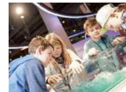
Experimentierfreude wird angeregt.

Aurich. Eine Klassenfahrt nach Aurich wird für Schüler der 5. bis 12. Klasse zu einer spannenden