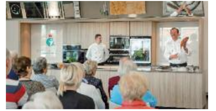
Die beiden Köchen bringen stets Leckeres auf die Teller.

„Jeder Besucher Bremerhavens sollte daher einen Zwischenstopp bei uns in der Schauküche einplanen. Hier gibt es nicht nur das wohlverdiente Mittagessen auf der Tagestour durch Stadt oder Land, sondern auch viele unterhaltsame