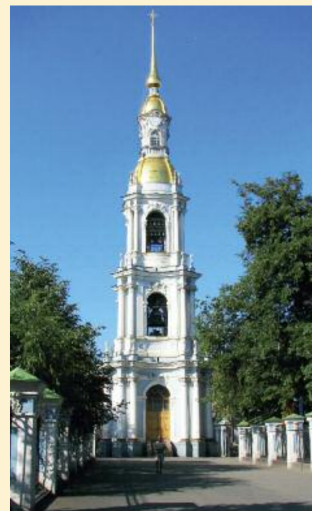
Glockenturm der St.-Nikolaus-Marine-Kathedrale.