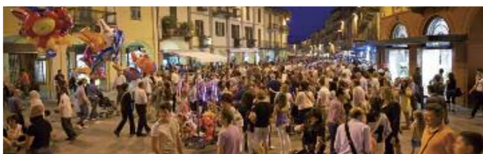
Emsiges Treiben in der Innenstadt – Saluzzo versteht zu feiern.

Burgstadt Saluzzo als busfreundlicher Standort für aktive Reiserlebnisse