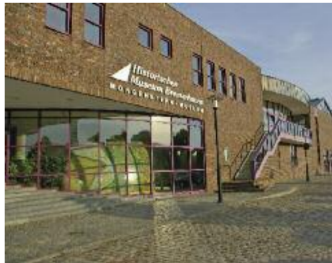
Blick auf das Historische Museum.