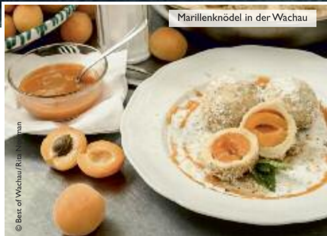
Marillenknödel in der Wachau