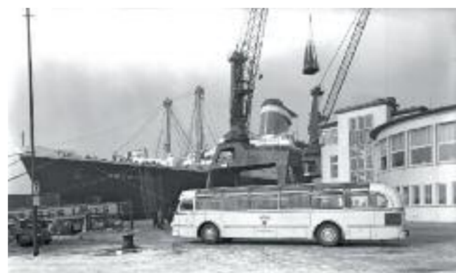
Das nicht näher datierte historische Foto aus den 1950er Jahren zeigt, dass auch zu Kässbohrers Zeiten die ersten Setra nach Bremerhaven führen...

Viel zum Schauen und Probieren bietet auch das „SonntagsVergnügen“ im Schaufenster Fischereihafen, das am 9. April zum ersten Mal in der Freiluftsaison 2017 stattfindet. Je nach Datum werden regionale Produkte, Käse, Grünkohl, Kürbis oder Fisch angeboten. Den Abschluss des kostenfreien Bauernmarktes markiert der 5. November 2017.