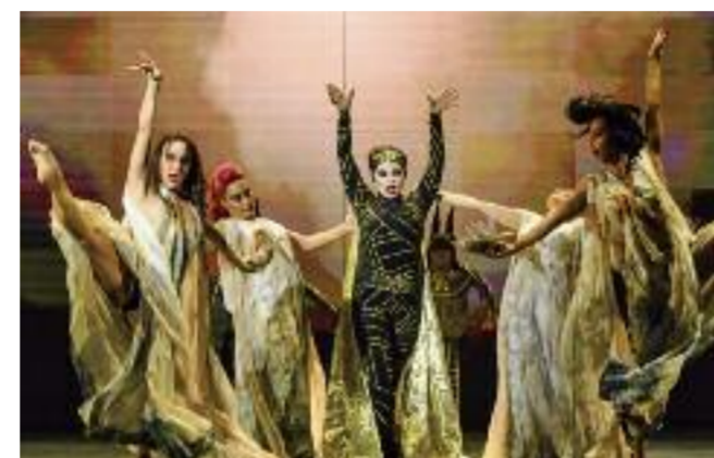
Hans Klok Divas-of-Magic.

und die Magier anschließend bei lebendigem Leib begrub... Hans Klok präsentiert in „House of Mystery“ die komplette Bandbreite spektakulärer Illusionen. Von der subtilen Kunst des Gedankenlesens, bis hin zur Hommage an Alfred Hitchcocks „Psycho“: es entsteht ein unheimlich magisches und ein magisch unheimliches Feeling! Menschen schweben, Schwerter klirren, Vampire, Zombies, Geister und „Haunted Dolls“ machen die Bühne zu einem mystischen Ort. Info unter Tickets: www.eventim.de www.sommel.de