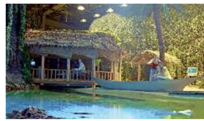
Auf der Lagune Samoas Boot fahren.

Im Klimahaus Bremerhaven gehen die Besucher auf eine Weltreise und erleben die Klimazonen der Erde hautnah. Immer entlang des achten östlichen Längengrades führt der Rundgang zu neun unterschiedlichen Orten auf fünf Kontinenten. Über den warmen Wüstensand in der Sahelzone geht es durch den tropischen Regenwald von Kamerun bis zum Packeis der Antarktis. Aufwendig gestaltete Landschaften sowie exotische Gerüche und Klänge sorgen für authentische Eindrücke der dargestellten Orte. Die passenden klimatischen Bedingungen runden das Weltreise-Erlebnis ab. Die außergewöhnliche Reise um die Welt können die Besucher nicht nur allein, sondern auch in der Gruppe erleben. Das Klimahaus ist eine Tagesausflugsmöglichkeit, die auch die Bedürfnisse