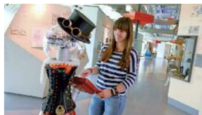
Museumsroboter Petra führt Besucher zu den Highlights des Museums.

Wenige Jahrzehnte später eroberten Computer alle Bereiche der Wirtschaft und hielten Einzug in den Alltag. Durch die Ausstellung werden spannende Führungen, auch verschiedenen Themenführungen, angeboten. Der Museumsbesuch wird durch das vielfältige Angebot des Bistro Hotspot vom Frühstück über das Mittagessen bis zu Kaffee und Kuchen abgerundet. In diesem Jahr feiert das HNF sein 20-jähriges Bestehen. Am 24. Ok-