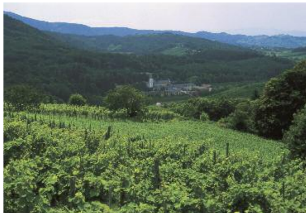
Grünes Slowenien: Blick auf Doleniska mit Kloster.

den. Bereits im Jahr 2010 stand unser Auftritt auf der Internationa-