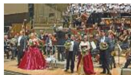
Das Sinfonie Orchester Berlin mit Solisten.