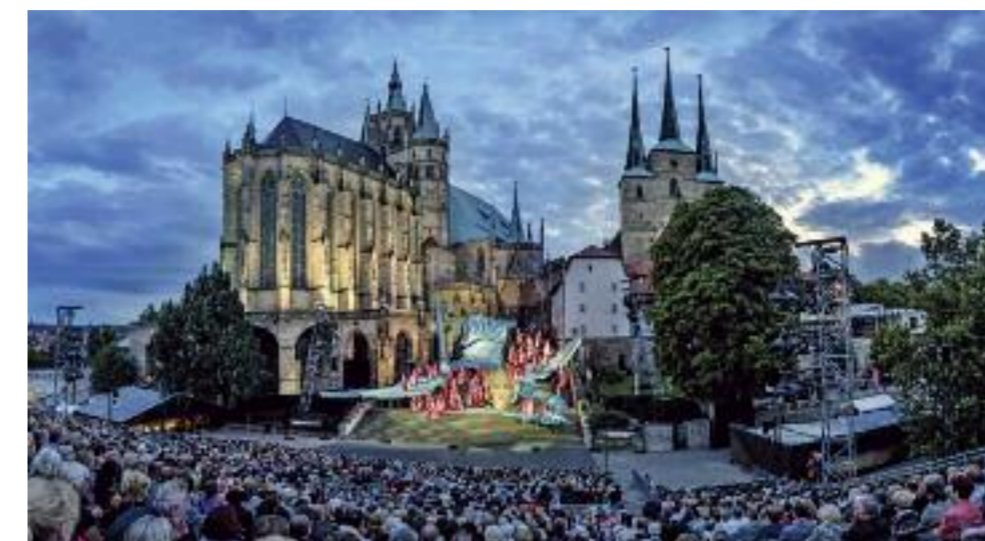
Der gewaltige Dom zu Erfurt, auf dessen Stufen sich das Geschehen abspielt.

Erfurt. Weit über die Grenzen Deutschlands hinaus haben sich die Domstufen-Festspiele einen Namen gemacht: sie sind das sommerliche Veranstaltungshighlight Thüringens! Dann verwandeln sich die 70 Stufen des Dombergs zur spektakulären Open-Air Festspielbühne. Seit 1994 bringt das Theater Erfurt in jedem Jahr ein neues Stück auf den Domplatz und damit vor die atemberaubende 700 Jahre alte Kulisse von St. Severi Kirche und Mariendom, in dem Martin Luther einst zum Priester geweiht wurde. 2017 erleben die Besucher Giuseppe Verdis Troubadour, der neben seinen Meisterwerken La tra-