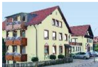
Gruppenfreundlich: Das Morada Hotel Bad Wörishofen.

Morada Hotel Bad Wörishofen in der Kneipp- und Thermalstadt