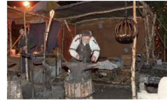
Handwerkskunst wird an manchem Stand präsentiert.

nutzen diese stimmungsvolle Möglichkeit zum Aufwärmen für muntere Gespräche in lockerer Runde und freuen sich auf Gäste aus Nah und Fern.