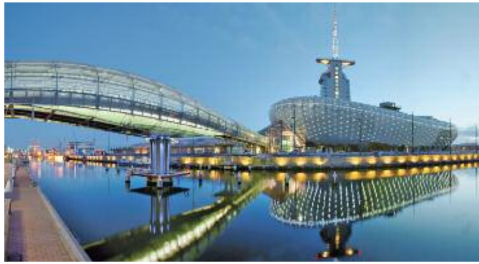
Ein Eyecatcher auch bei Nachtbeleuchtung: Das Klimahaus.