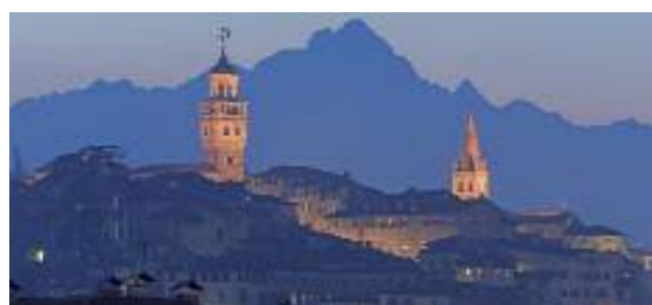
Saluzzo, Panorama bei Nacht vor dem Monviso.

Das Outdoor-Thema kommt hier nicht zu kurz: Biken auf gut gestalteten Radwegen, Wanderungen durch die Obstgärten und am Abend das Erlebnis einer mittel-