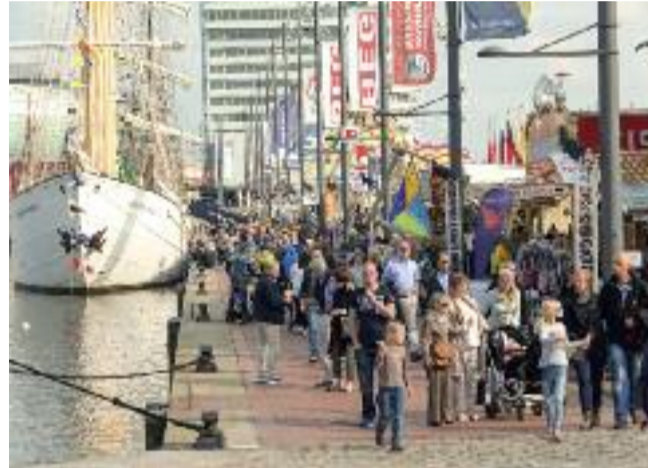
Beim ersten SeeStadtFest in den Havenwelten.