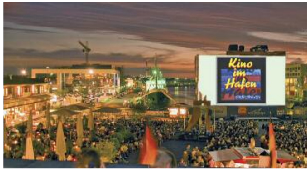
Großer Andrang herrscht beim Kino im Hafen in den Havenwelten.