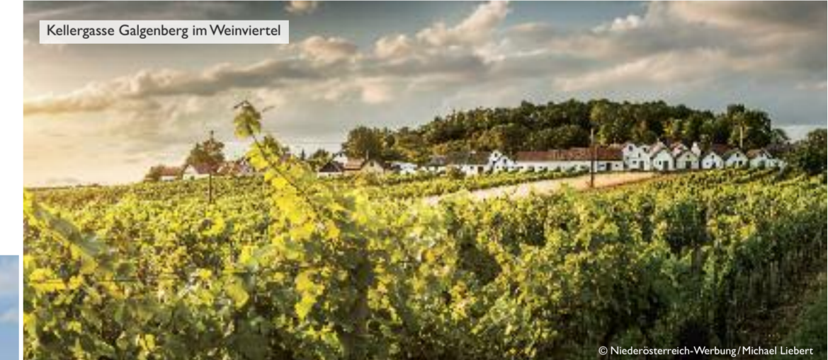
Kellergasse Galgenberg im Weinviertel