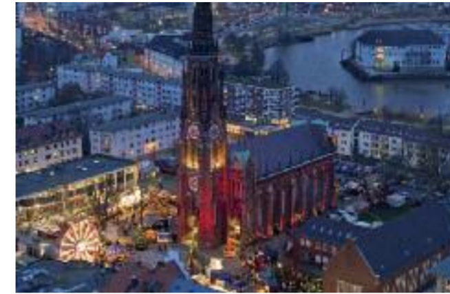
Blick von oben auf den Weihnachtsmarkt um die „Große Kirche“.

In der Bremerhavener Weihnachtswelt wird Geselligkeit groß geschrieben: Mittenlang der Haupt-Einkaufsstraße „Bürger“ gelegen, hat der Weihnachtsmarkt vom 21. November bis zum 22. Dezember täglich von 11 bis 20.30 Uhr und donnerstags bis samstags bis 21.30 Uhr geöffnet. Im „Grogdorf“ vor der „Bürgermeister-Smidt-Gedächtniskirche“ oder beim Hüttenzauber im Winterdorf auf dem Theodor-Heuss-Platz werden Kakao, Glühwein, Punsch oder eben Grog ausgeschenkt. Die Bremerhavener