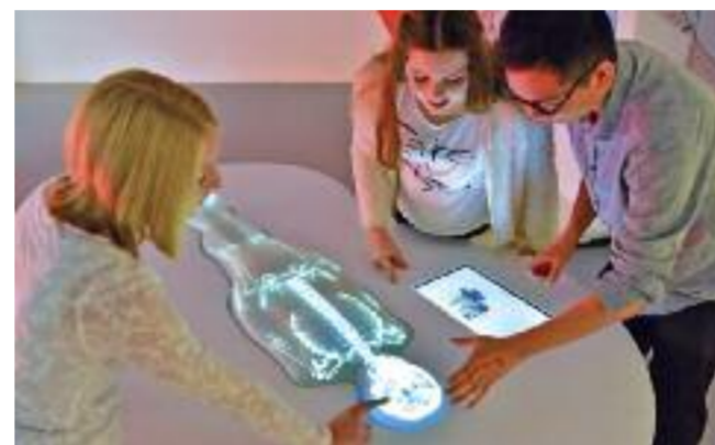
In der Smart World erkunden Besucher, wie mithilfe modernster Sensorik Körperdaten erfasst werden.

tober 1996 eröffnete Bundeskanzler Helmut Kohl das Haus. Dieses Jubiläum begeht das HNF mit einer Woche voller Veranstaltungen vom 24. bis 30. Oktober und präsentiert vier neue Ausstellungsbereiche, die den Museumsbesuch einzigartig machen. „Die Welt im Netz“ zeigt die faszinierende Geschichte des Internets vom ersten Telegraphenkabel bis zum täglichen Einfluss des Internets auf unser Leben. Die „Geschichte der Videospiele“ entführt in die Zeit von Pong, Tetris