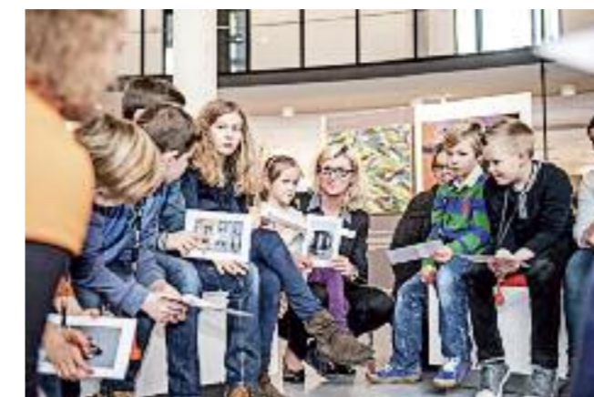
Schüler lernen hier viel über Energie.